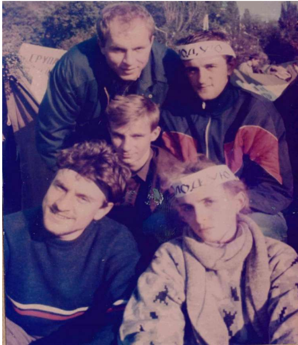
Голодуючі студенти у білих пов'язках та охоронець табору із чорною пов'язкою на голові.