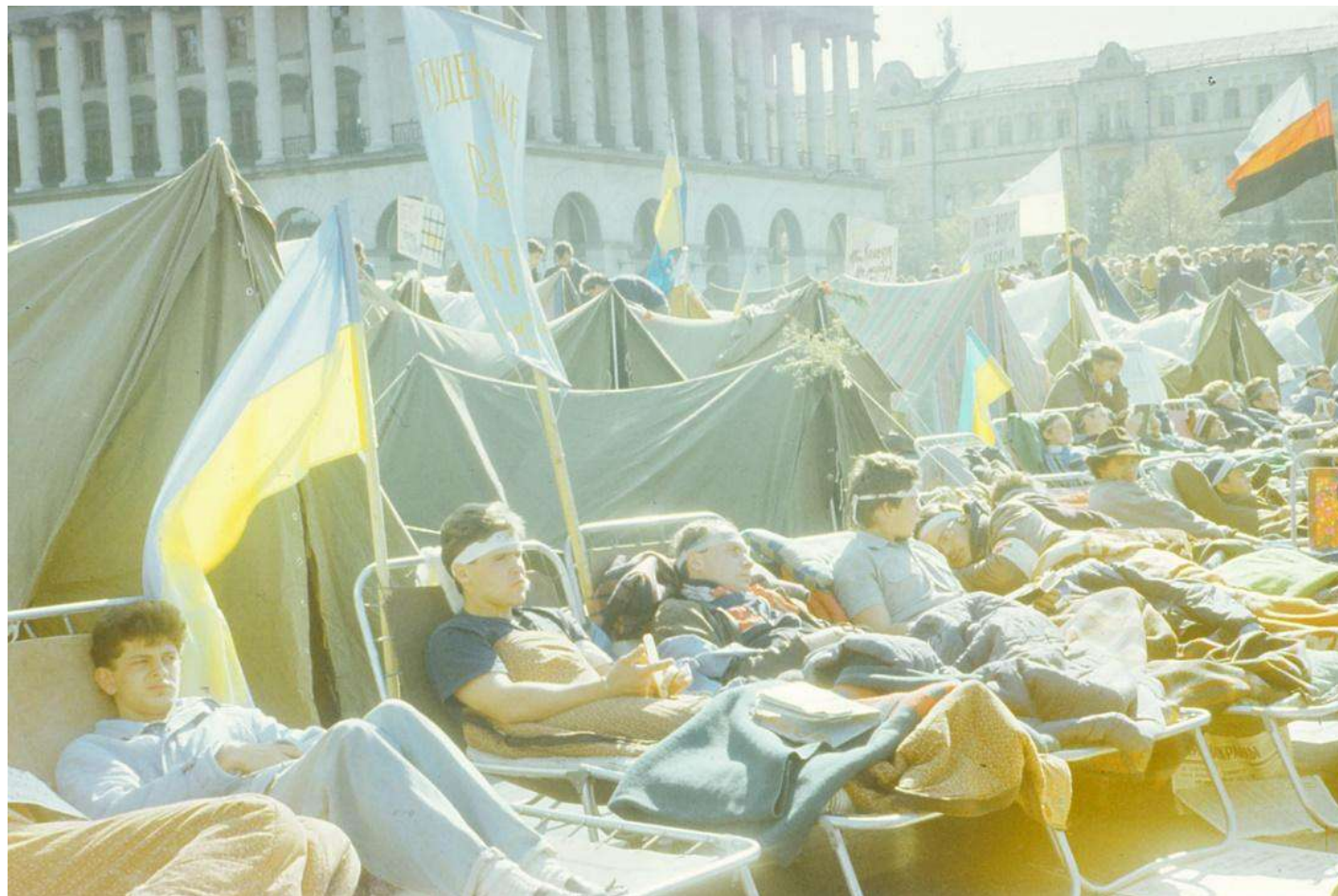
Учасники голодування.

Ще частина учасників носила чорні – ті, хто відповідав за безпеку голодувальників.