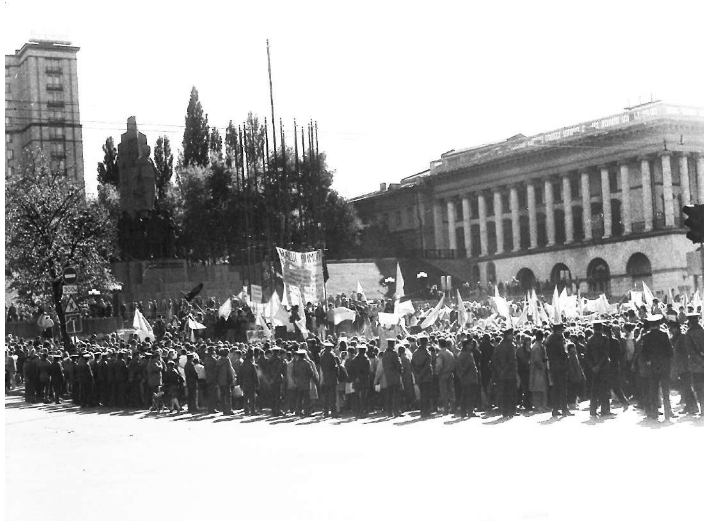
Кордони міліції навколо наметового містечка у середмісті столиці. Вигляд табору протестувальників.

На стрічці, якою був огорожений табір, протестувальники повісили аркуш з написом «майдан Незалежності».