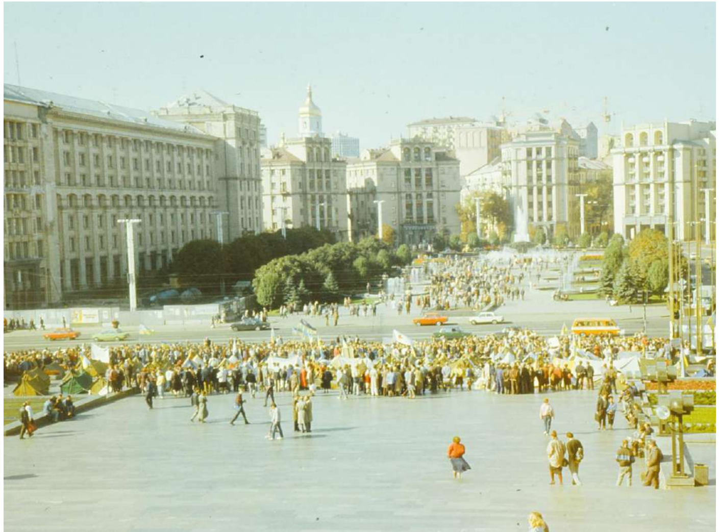
Вигляд табору протестувальників.

Після цього протест, який до того називали Студентським голодуванням на граніті, отримав назву «Революція на граніті».