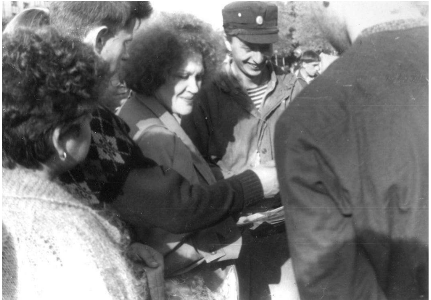
Поетеса Ліна Костенко у таборі голодуючих студентів.