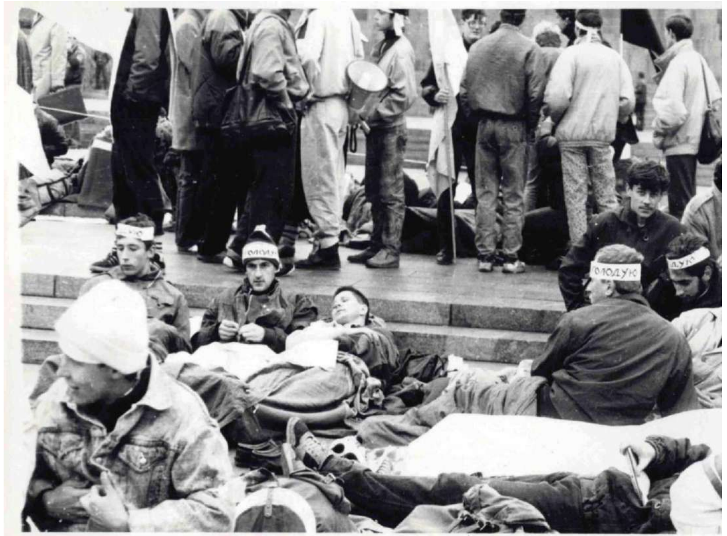
Першій день голодування. Світлина Олеся Пограничного з цифрового архіву НМРГ.

Акцію планували провести під будівлею Верховної Ради. Проте вранці 2 жовтня загони міліції оточили споруду. Частина мітингувальників, які вийшли на площу Жовтневої революції, вирішили розпочати протест там. Увечері на головній площі Києва з'явилося наметове містечко.