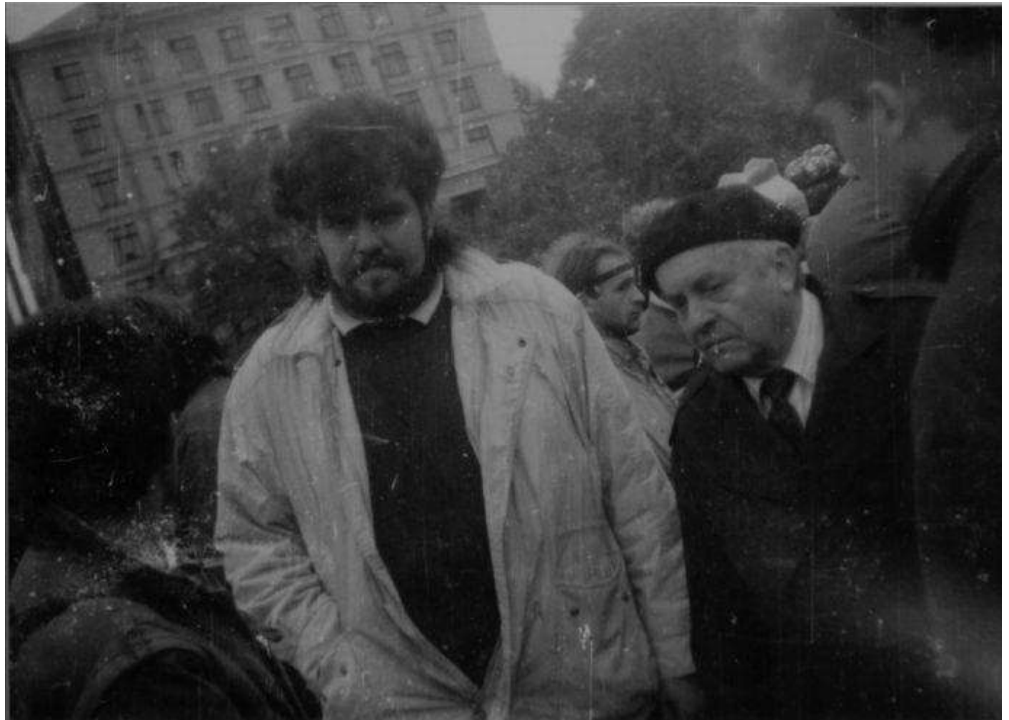
Голова СБЛ Маркіян Іващишин і поет, народний депутат СРСР від демократичних сил Ростислав Братунь у студентському наметовому містечку.