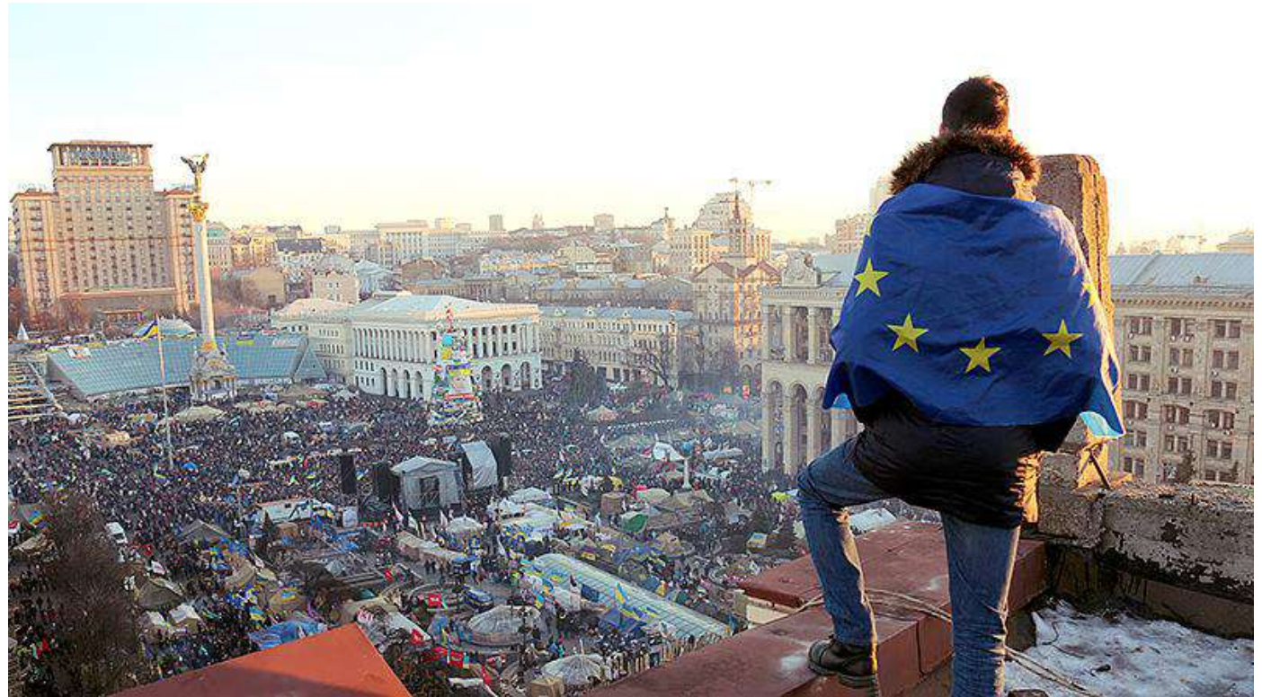
Євромайдан / Революція Гідності.

Сформовано покоління активістів, які продовжили громадянську та політичну діяльність у незалежній Україні та стали активом наступних Майданів: Помаранчевої революції та Революції Гідності.