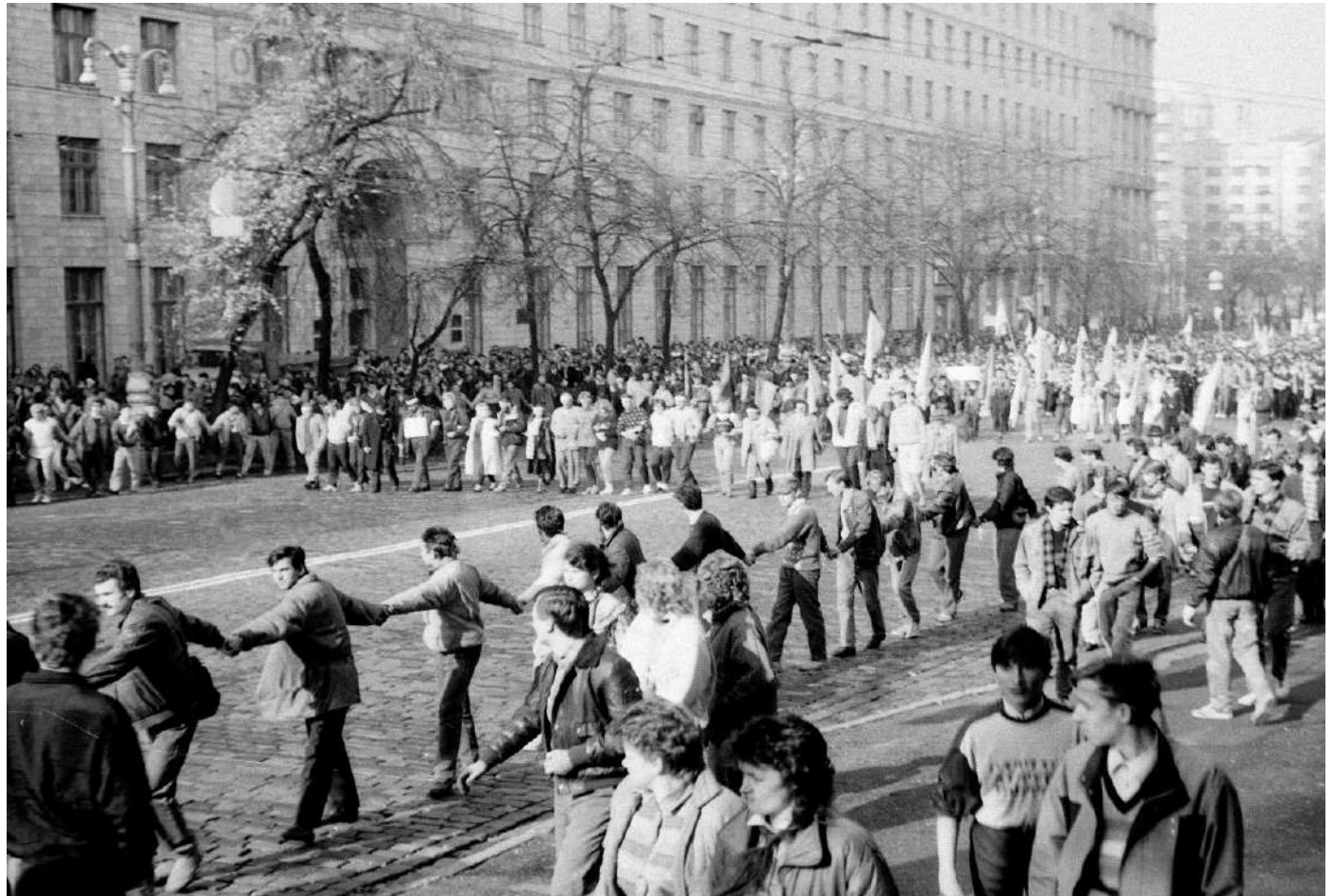
Хода до будівлі Верховної Ради УРСР.