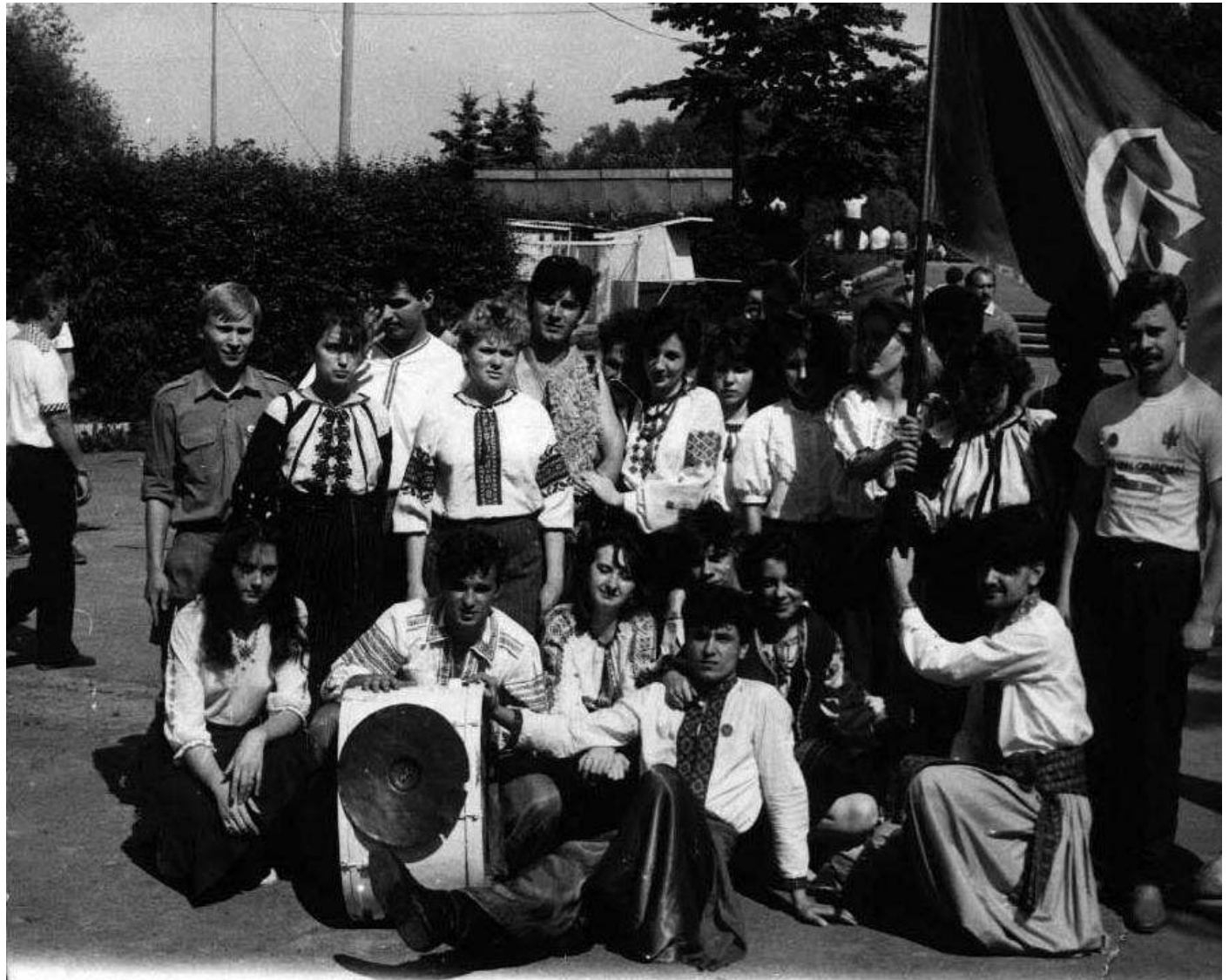
Учасники Студентського братства Львова.

Студентське братство Львова налагодило контакти з іншими українськими студентськими об'єднаннями, зокрема Українською студентською спілкою (УСС). На спільній нараді ухвалили рішення розпочати акції протесту на початку жовтня 1990 року.