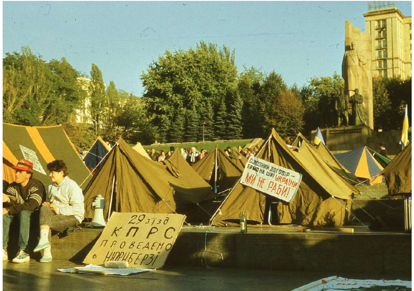
Плакати наметового містечка.